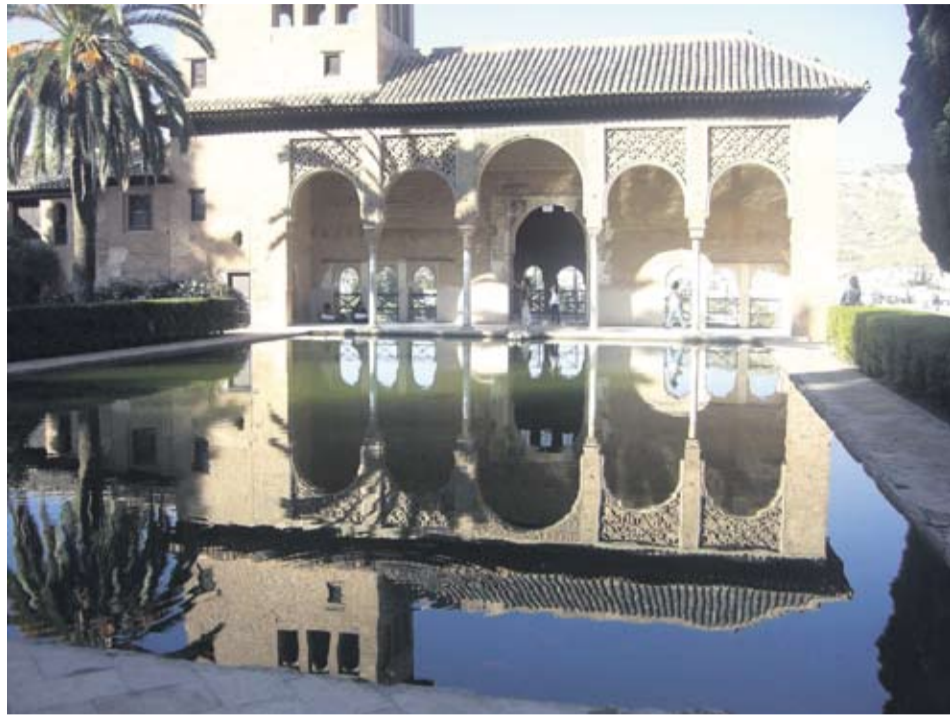
UDSIGT. Torre de las Damas er en af Alhambras ældste bygninger. Fra bygningen er der en imponerende udsigt over mod den arabiske bydel Albaicin.