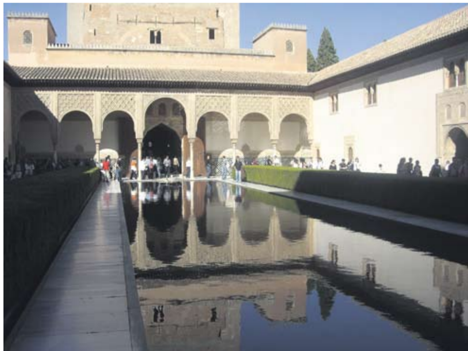
MYRTEGÅRDEN. Patio de los Arrayanes var oprindeligt beplantet med myrtehække, fordi den gav tæt skygge og dermed forhindrede for stor fordampning af det livgivende vand.