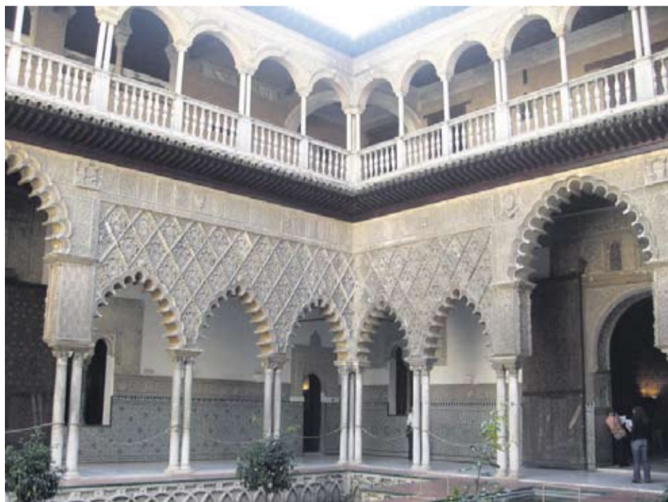
ALCAZAR. Et af paladserne i Alcazar, Sevillas kongepalads, der er bygget i mudéjar-stil (mauriske håndværkere og kristne bygherrer). Overetagen er bygget i europæisk renæssance-stil.

skin, der filtrerer den knivskarpe luft og giver dybde i landskabet. Spaniens mest besøgte turistattraktion Alhambra knejser derovre på sin bjergtop. Imellem os er en dyb slugt og her på en anden bjergtop, står jeg og min rejsegruppe i den arabiske bydel Albaicin og betages af synet.