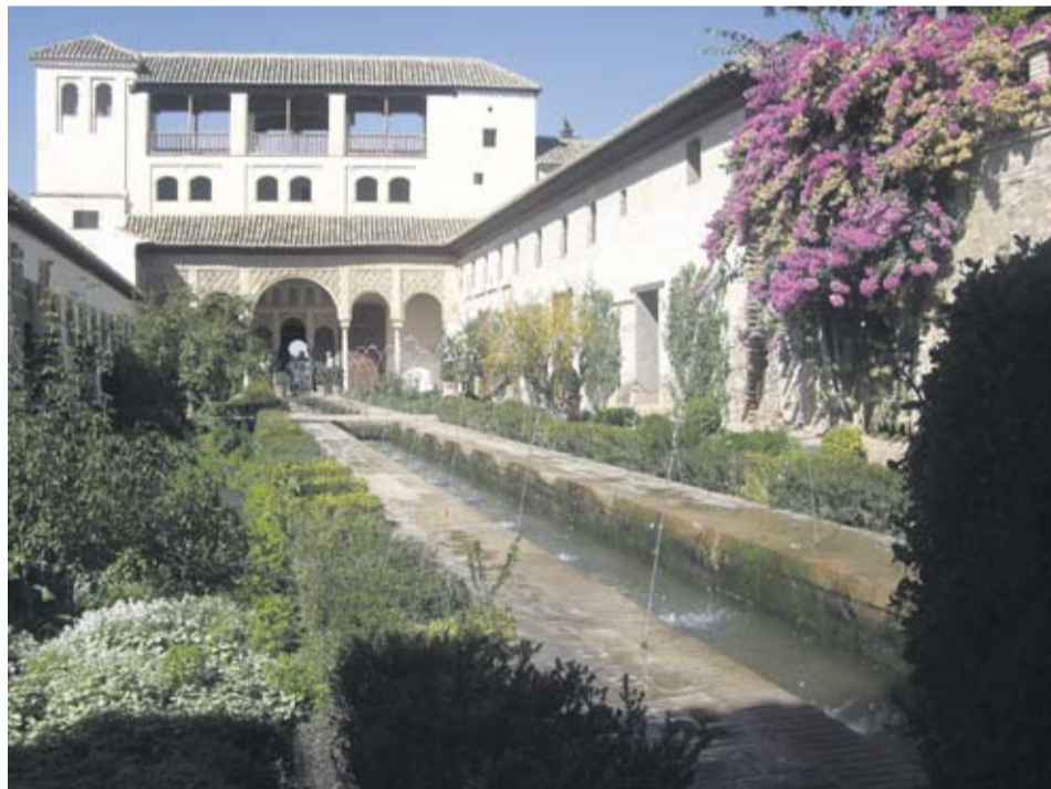
HAVEKUNST. Generalife er en del af Alhambra og et sted, hvor den muslimske leder trak sig tilbage for at holde siesta eller få besøg af elskerinde.