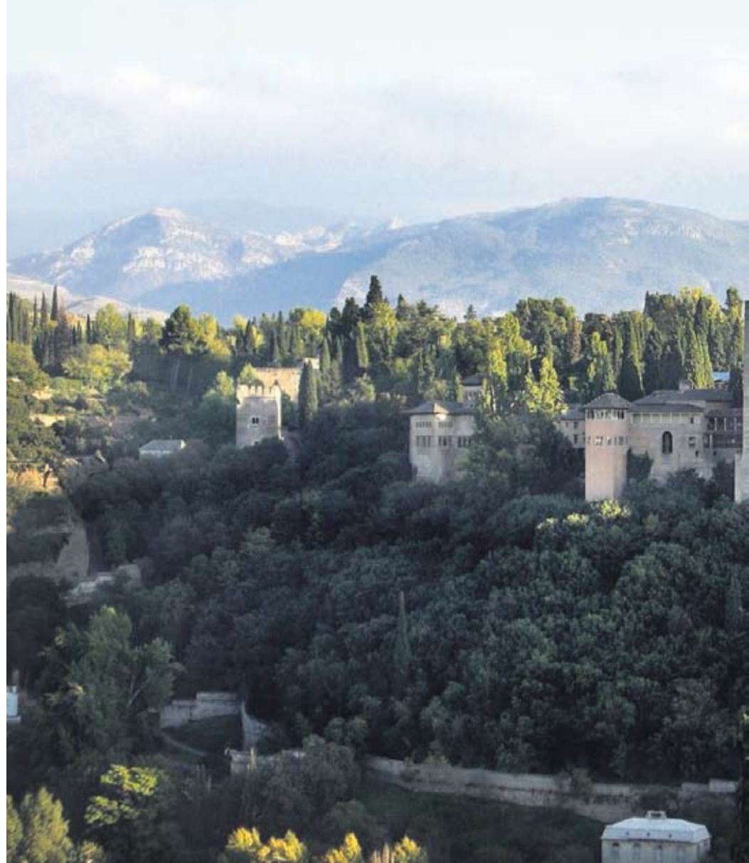
FORSVAR. Alhambra er en tidligere islamisk paladsby, som er strategisk beliggende på en bjergtop.

I næsten 800 år frem til 1492 var det meste af Spanien underlagt muslimske herskere. Det har sat markante spor for eftertidens Spanien. Avisen tog med Cramon Kulturrejser på en ni dages rundtur til den islamiske arkitektur og havekunst i Granada, Cordoba, Sevilla og Ronda. En rundtur, der pirrede alle sanser.